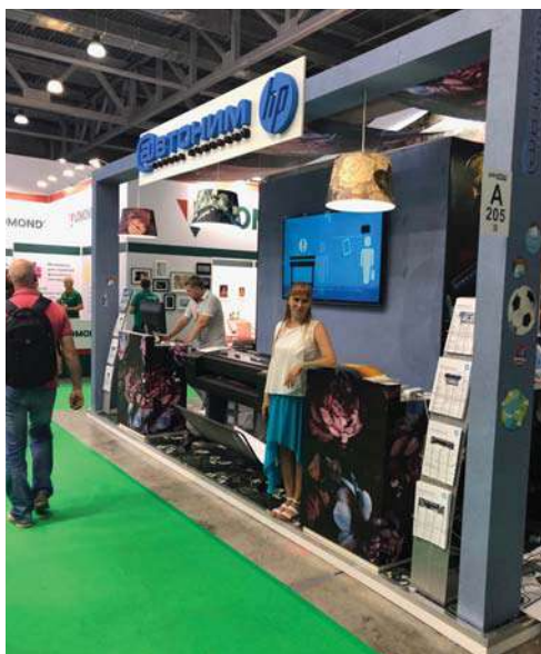
Многолетнее сотрудничество компании HP и Автоним на выставках.

Группа компаний «Автоним» получила награду как «Самая сбалансированная структура бизнеса в области продаж широ-